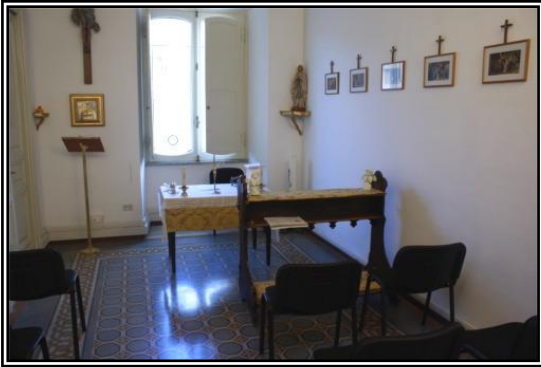
Visita de las oficinas de la WFRM en Roma: en la foto, la pequeña y acogedora capilla en el interior de la sede en Corso Vittorio Emanuele II.