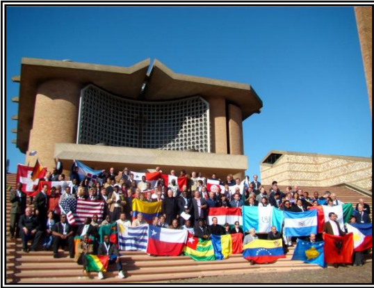
16 de octubre: la foto final con todos los participantes y colaboradores ante el Santuario del Amor Misericordioso en Collevalenza.

HAREMOS REALIDAD LOS FRUTOS DEL IV CONGRESO QUIENES ESTAMOS INCORPORADOS POR MEDIO DEL VOLUNTARIADO AL MARAVILLOSO PROYECTO DE EVANGELIZACIÓN DE LA VIRGEN MARÍA EN GUATEMALA Y EL MUNDO.